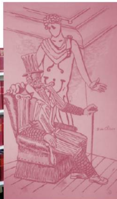
Dessin de G. de Chirico, couverture du programme des Ballets de Serge de Diaghilev (1929).

Près de 6.000 ouvrages aux thématiques éclectiques (histoire, géographie, littérature, sciences, océanographie, encyclopédie, biographies, etc.) avaient été choisis et rassemblés par Monsieur Labande, chargé également de leur mise en place. Le Prince forme alors l'espoir que "chacun aura à cœur d'enrichir cette bibliothèque" qu'il a "le plus vif désir de voir se développer pour le plus grand bien du pays".