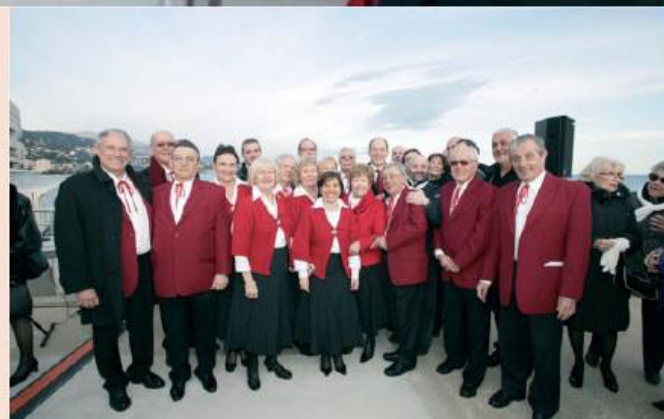
U Cantin d'a Roca