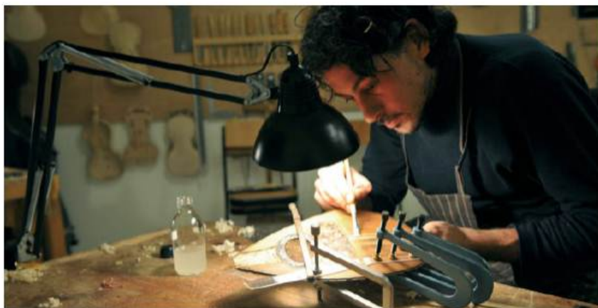
Atelier de lutherie

Aujourd'hui, avec plus de 800 élèves inscrits, 56 professeurs et 13 employés à son administration, l'Académie de Musique et de Théâtre Fondation Prince Rainier III dispose de compétences et d'équipements qui la placent au tout premier rang des établissements d'enseignement artistique spécialisé, et peut s'enorgueillir d'avoir formé de nombreux talents qui brillent désormais par leur remarquable carrière.