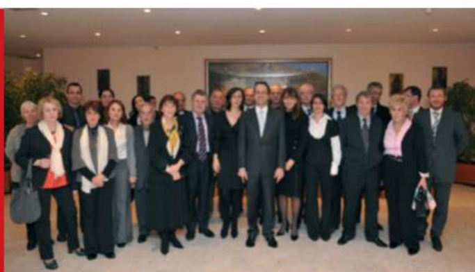
Réception en l'honneur de la délégation corse de Lucciana offerte par le Maire de Monaco et les membres du Conseil Communal à l'occasion de la Sainte Dévote.