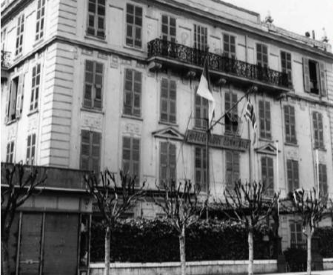
La Bibliothèque rue Suffren Reymond, avant 1957