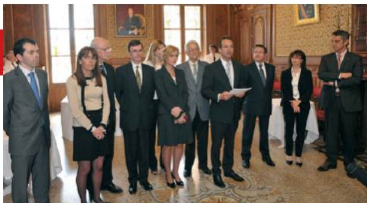
Lancement en Mairie le 27 mars dernier de la Carte d'Identité Monégasque Electronique